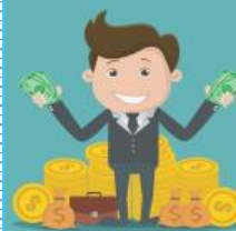
V DETSTVE CHUDOBNÝ