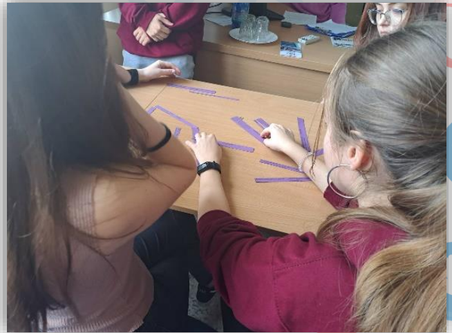
Deň Eko-módy a enviro aktivity